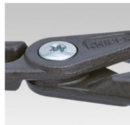
Шарнир свързан с болт: висока прецизност и оптимална подвижност