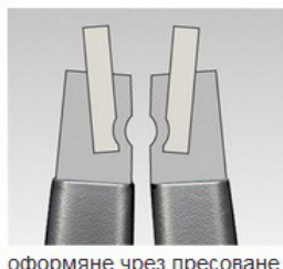
оформяне чрез пресоване